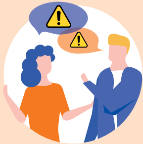
Familien- und Freundeskreis, Nachbarschaft